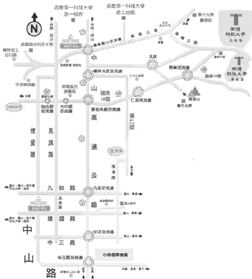
樹德科技大學 交通指示圖